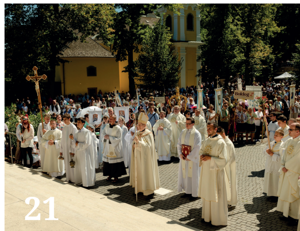
Nagyboldogasszony ünnepe: „Amikor a zarándoklatról hazatérünk, figyeljük az eseményeket, mert lehet, hogy szelíden kirajzolódik a láthatáron problémánk megoldása, kilátástalan helyzetünk jóra fordulása” – mondta Erdő Péter bíboros