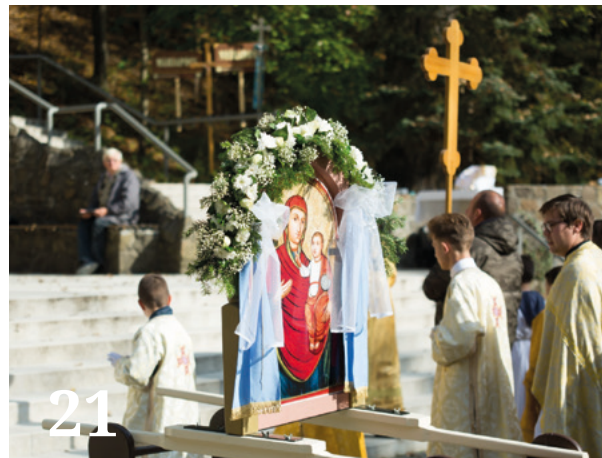
Görögkatolikus hívek búcsúja: A Mária-ikon megtalálása és restaurálása alkalmából készített zarándokoszlopra a többi kegyhely mellett Szentkút nevét is felírták