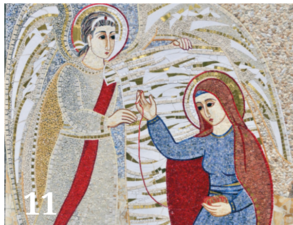
Az angyali üdvözet mozaikja: a nem mindennapi angyali jelenés és Mária mindennapi tevékenységének bemutatása