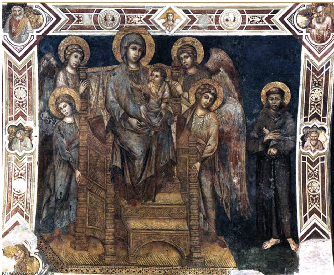
Kép: Cimabue: Trónoló Madonna, Szent Ferenc-bazilika, Assisi