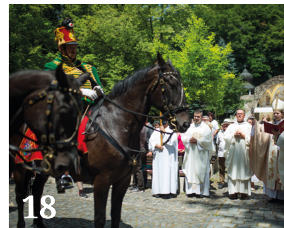
Szent László ünnepe: A lovas zarándoklat Mátraverebély-Szentkút egyik leglátványosabb eseménye